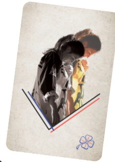
Bertille Chedanne Jeu de cartes

Pour poursuivre l'expérience d'écoute autour de l'album, nous avons créé un clip ainsi qu'un jeu de cartes , basé sur l'écoute active des textes et des ambiances suggérées par les morceaux.