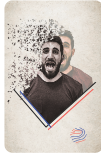
William Leboul Création graphique