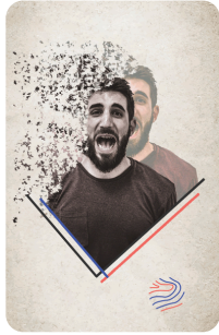
William Lebouh Création graphique