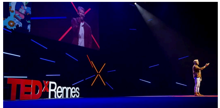
Performances pour les conférences TedX 2021 Rennes - Le Liberté