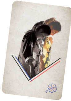
Bertille Chedanne Jeu de cartes

Pour poursuivre l'expérience d'écoute autour de l'album, nous avons créé un clip ainsi qu'un jeu de cartes , basé sur l'écoute active des textes et des ambiances suggérées par les morceaux.