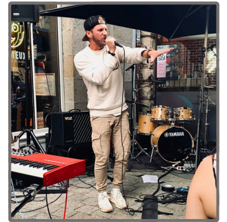
Présentation live de l'album Fête de la musique - Rennes