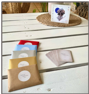
Jeu de cartes, CD

Pour poursuivre l'expérience d'écoute autour de l'album, nous avons créé un clip ainsi qu'un jeu de cartes , basé sur l'écoute active des textes et des ambiances suggérées par les morceaux.