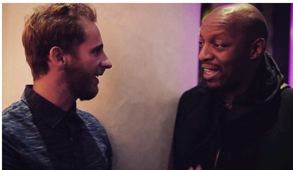
Sélection Carte Blanche à Oxmo Puccino 30 ans de l'Institut du Monde Arabe - Paris

Faire découvrir des lieux, des oeuvres ou encore de l'artisanat par le Slam. Avec Destination Rennes, le musée des beaux-arts, le TNB, etc.